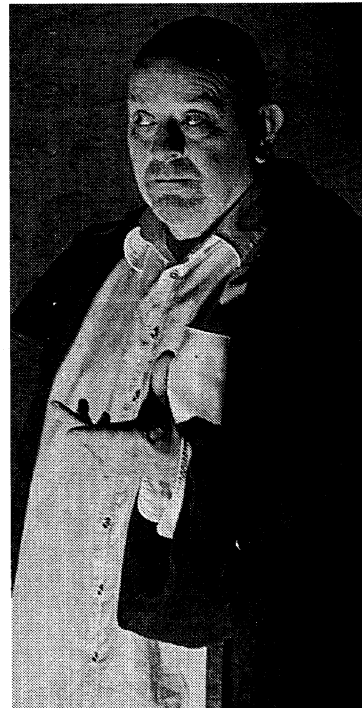
Un conteur blafard, trois histoires fantastiques, grand frisson garanti.

L'ambiance humide des caves donne l'écho idéal à ces récits glaçants, que vient renforcer la vapeur qui sort de la bouche du conteur... Une atmosphère lugubre et fantastique qui sied à merveille aux lieux, un moment de pur plaisir, du frisson au propre et au figuré, une vraie réussite, que les personnes présentes ont appréciée comme un cadeau.